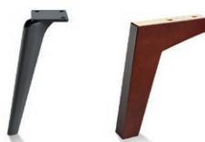
Carmen Brushed Black Chrome drewniana Carmen