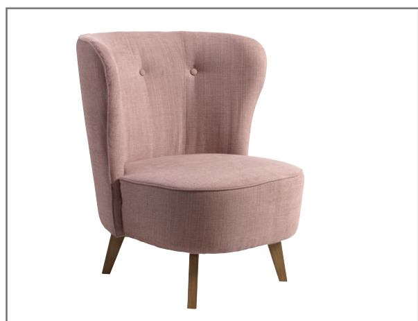
Carmen; wersja podstawowa; nóżki drewniane CARMEN

Fotel typu Carmen, to fotel-kameleon, można by rzec. Wszystko za sprawą tapicerki, która w zależności od barwy i struktury, zgrabnie dostosowuje się do charakteru otoczenia. Kształt fotela z kolei, odznaczający się miękką, łagodną w zagięciach linią, skutecznie zachęci do zatopienia się w nim i odpłynięcia w krainę błogiego relaksu.