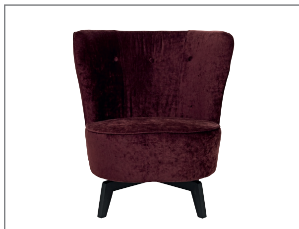
Carmen, wersja obrotowa